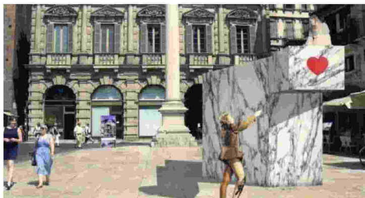
Un'opera della passata edizione in piazza delle Erbe

Da oggi, 27 settembre, giorno di apertura di Marmomac, fino alla fine di ottobre, dodici opere, realizzate negli anni recenti con sofisticati macchinari, dialogheranno con i monumenti e con i palazzi storici di Verona, creando così un ponte tra passato, presente e futuro in cui viene esaltata la bellezza della pie-