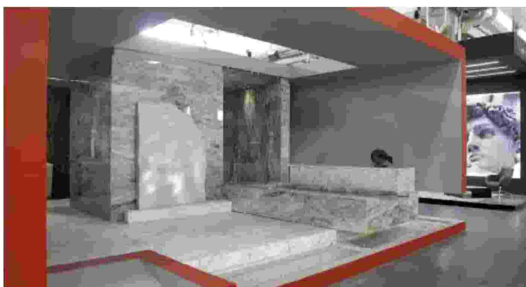
L'allestimento dello stand è fondamentale per l'immagine che un'azienda vuole veicolare

Un colpo d'occhio, un allestimento, la scelta cromatica o di lettering, una particolare esposizione del prodotto dai blocchi