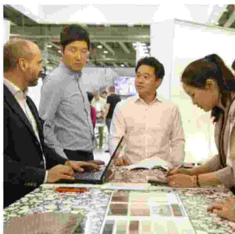
Espositori e visitatori dall'estero sono sempre più numerosi

Tutto questo è confermato, di edizione in edizione, dai numeri del salone. Marmomac 2016 ha registrato 67.186 visitatori provenienti da 146 nazioni, con il 60,00% di visitatori Internazionali. 1.670 sono stati gli espositori della passata edizione, con 52 Paesi rappresentati ed il 64,07% di espositori Internazionali, su una superficie di 80.439 mq. (+4,38% sul 2015).